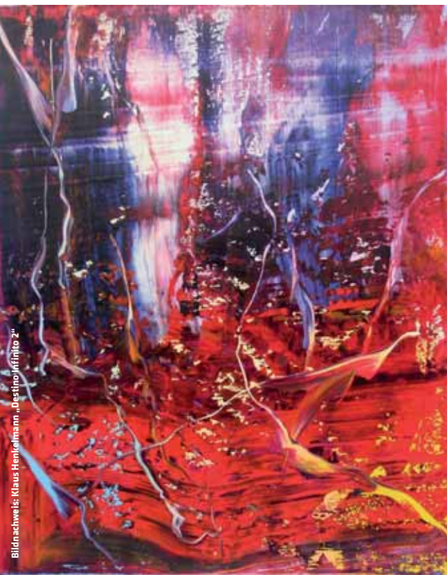
Bildachweis: Klaus Henkelmann, „Destino Infinito 2“

Salzburg Congress Auerspergstraße 6 5020 Salzburg